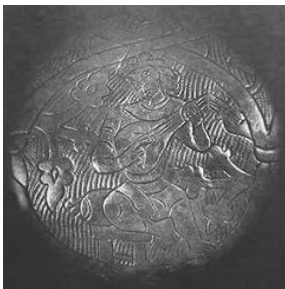
Рисунок 10б. Деталь византийской серебряной чаши XII в.

Рисунок 10а, 10б – Среднеазиатские и византийские лютневые инструменты.