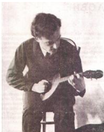
Рисунок 30. Фотография посадки домриста-четырёхструнного из школы Н. Н. Кудрявцева–С. Н. Тэш