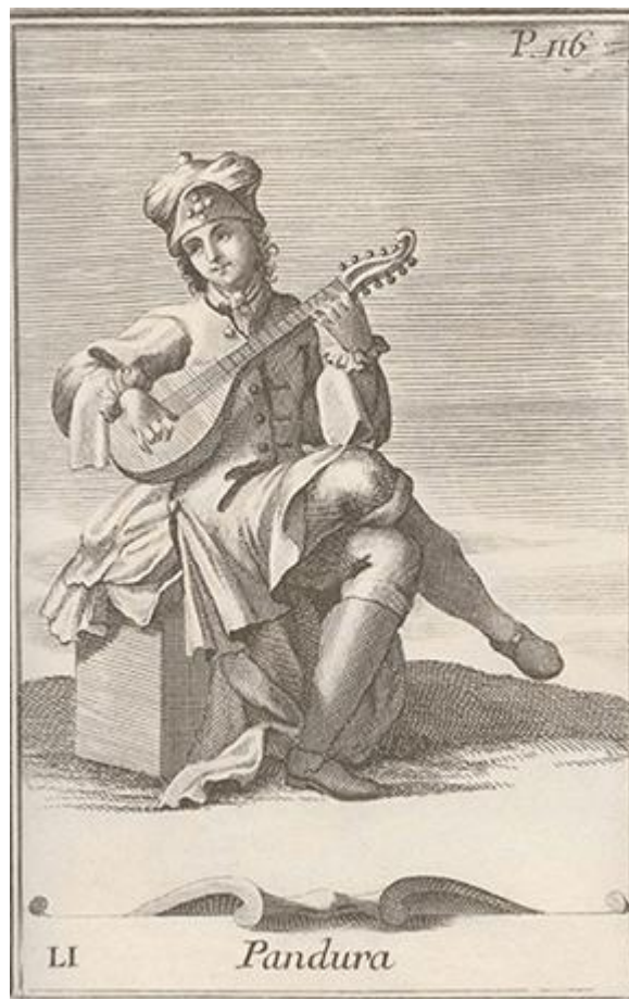
Рисунок 12. Пандура, XVI в.