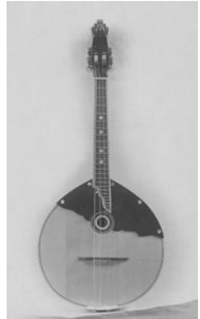
Рисунок 24. Четырехструнная домра прима. 1930-е гг. [276, л. 41]