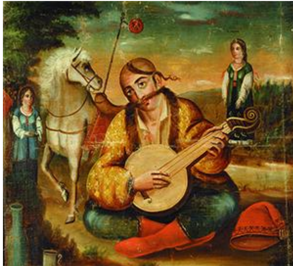
Рисунок 11. Казак мамай с кобзой. Украинский народный лубок, начало XIX в.