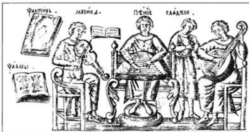
Рисунок 15. Изображение из букваря Кариона Истомина. Конец XVII в.