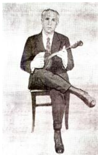
Рисунок 31. Фотография посадки домриста-трёхструнного из школы А. С. Илюхина–А. С. Чагадаева