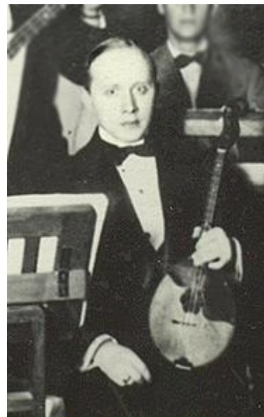
Рисунок 28. Алексеев Петр Иванович