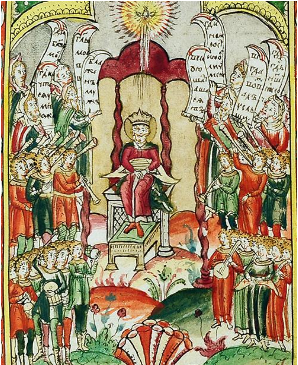
Рисунок 5. Фрагмент миниатюры из Псалтыри толковой последней трети XVII в. ОР РГБ. Ф. 98. № 201. Л. 62 об.