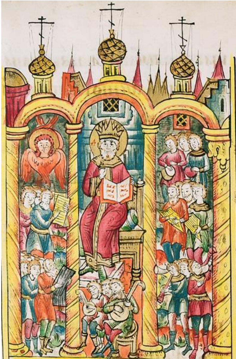
Рисунок 3. Миниатюра из Псалтыри толковой последней трети XVII в. ОР РГБ. Ф. 98. № 201. Л. 22 об.