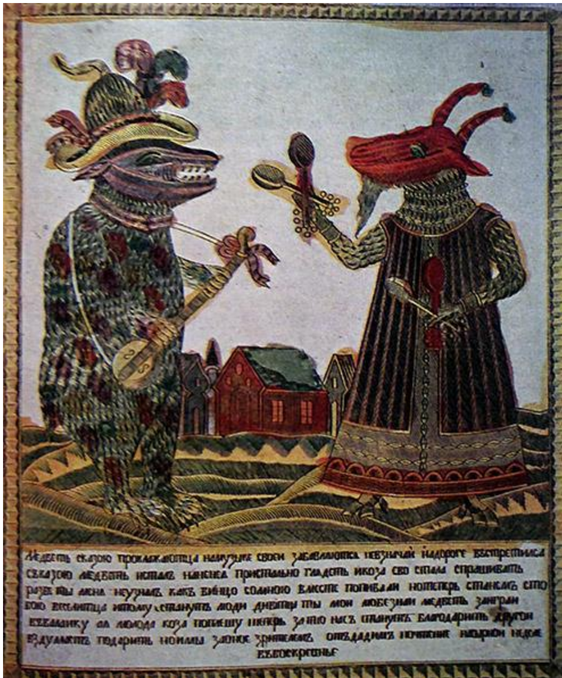
Рисунок 13. Медведь с козой. Русская картинка XVIII в.