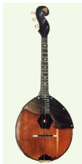
Рисунок 21. Домра № 113, мастер С. И. Налимов, 1913 г.