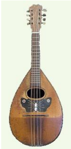
Рисунок 22. Неаполитанская мандолина, XX в.