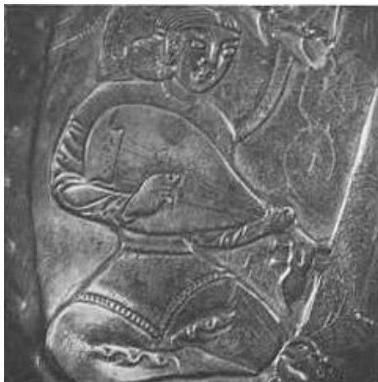
Рисунок 10а. Изображение лютниста на иранском серебряном блюде VIII–IX вв.