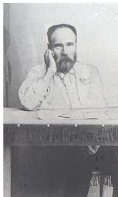
Рисунок 18. Налимов Семен Иванович