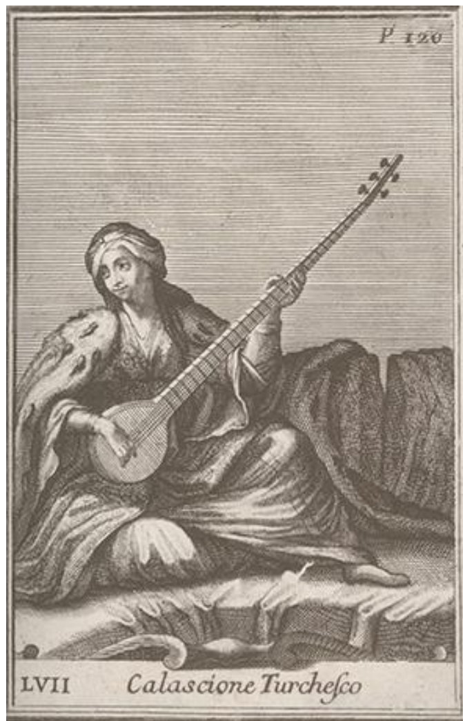
Рисунок 9. Турецкий колашон, XVI в.