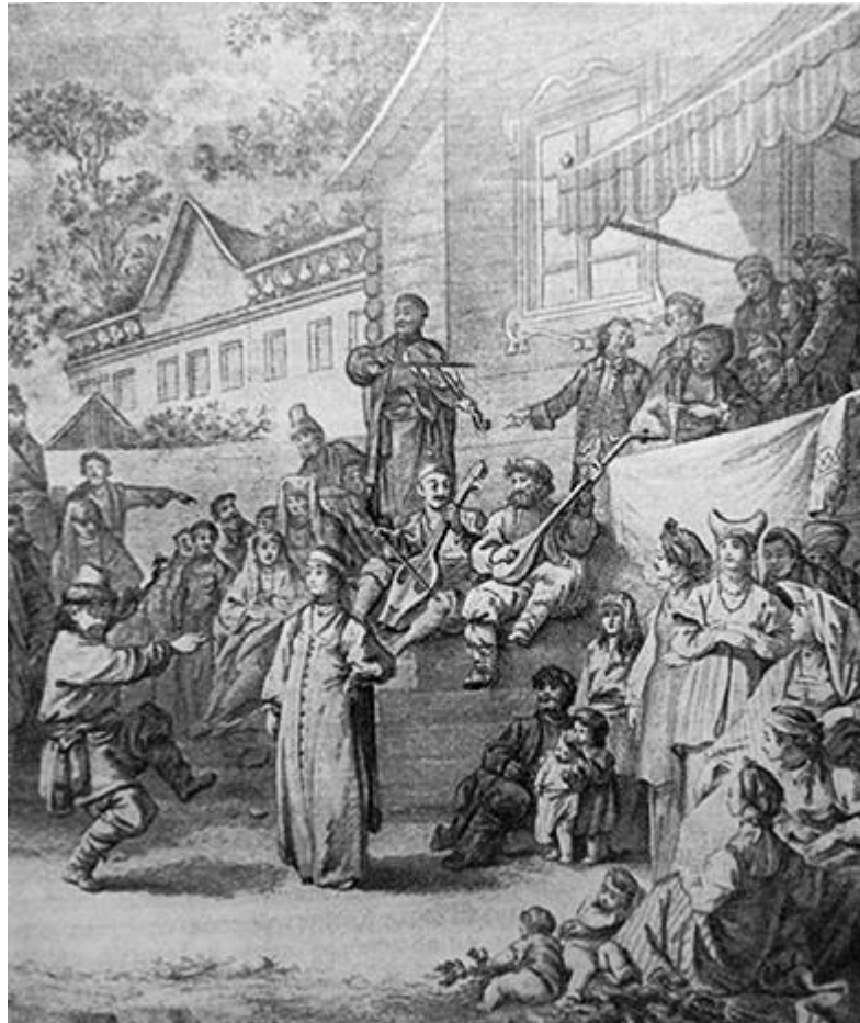
Рисунок 14. Ж.-Б. Лепренс. Русская пляска. Вторая половина XVIII в.