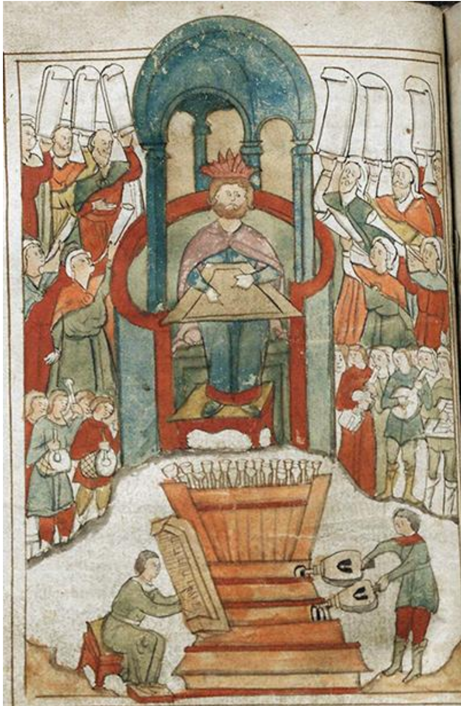
Рисунок 2. Миниатюра из Апокалипсиса XVII в. ОР РГБ. Ф. 98. № 1342. Л. 86 об.