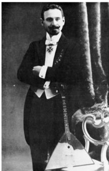
Рисунок 16. Андреев Василий Васильевич