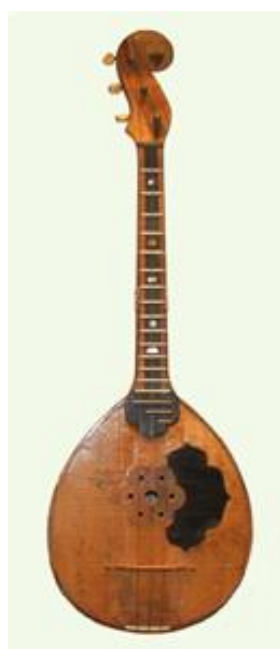
Рисунок 20. Домра № 18, мастер С. И. Налимов, 1898 г.