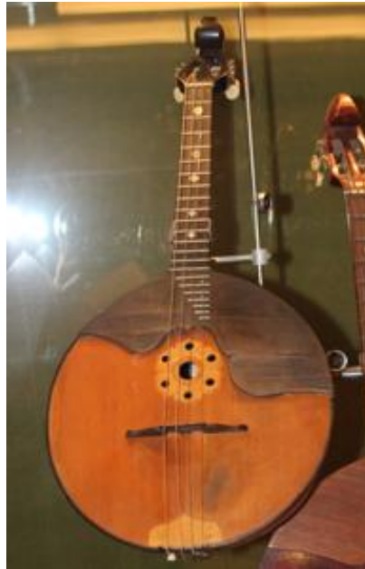
Рисунок 23. Четырехструнная домра прима, мастер С. Ф. Буров, 1913 г.